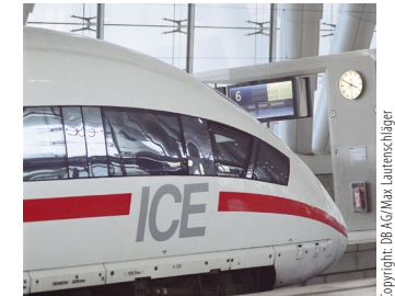
Abbildung 5: Große Wagenanschriften sind ein Blickfang.

Bitte stellen Sie daher Ihren Beitrag mit aussagekräftigen Abbildungen und Infografiken aus und verfassen Sie aussagekräftige Bildunterschriften, die das Interesse für den Beitrag wecken. Sollten Sie zudem einen Vorschlag für ein attraktives Aufmacherfoto haben, können Sie dies der Redaktion mitteilen. (Siehe dazu 3.1 und 4.5!)