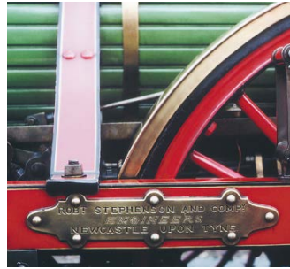
Abbildung 9: Typenschild des Herstellers.

Der Copyright-Vermerk nennt den Eigentümer der Bildrechte und unter Umständen auch den Urheber (Grafiker, Fotograf oder andere). In der „Mediathek der Deutschen Bahn“ finden Sie diese Angaben grundsätzlich in den Informationen zum Bild. Bei anderen Quellen müssen Sie den Copyright-Vermerk gegebenenfalls anfordern.