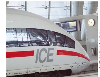
Abbildung 5: Große Wagenanschriften sind ein Blickfang.

Bitte stellen Sie daher Ihren Beitrag mit aussagekräftigen Abbildungen und Infografiken aus und verfassen Sie aussagekräftige Bildunterschriften, die das Interesse für den Beitrag wecken. Sollten Sie zudem einen Vorschlag für ein attraktives Aufmacherfoto haben, können Sie dies der Redaktion mitteilen. (Siehe dazu 3.1 und 4.5!)