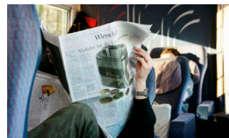
Abbildung 7: Ohne Störung bis ans Ziel.

zu achten. Mittels kurzer Sätze erleichtern Sie Ihren Lesern zudem das Verständnis.