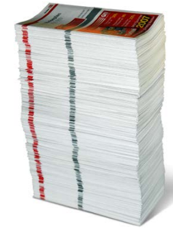
Abbildung 8: Wer weiter will, ist für Zusatzinformationen dankbar.

Genau wie Hersteller von Schienenfahrzeugen oder Schienenfahrzeugkomponenten ihre Produkte mit Herstellervermerken kennzeichnen, so müssen in Fachbeiträgen Informations- und Bildquellen genannt werden. Bei nicht von Ihnen selbst erstellten Abbildungen (Fotos, Grafiken etc.) liegt es in Ihrer Verantwortung, die Nutzungsrechte zu prüfen und den Copyright-Vermerk mitzuliefern.