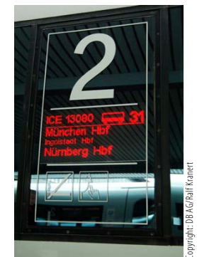
Abbildung 3: Einsteigen oder nicht? Dies beantwortet der Zuglaufanzeiger.