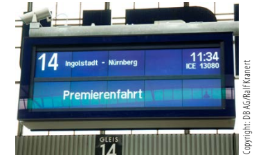
Abbildung 2: Der Fahrtrichtungsanzeiger klärt, wo die Reise hingehet.