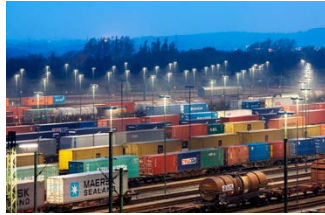
Abbildung 4: Nur mit Planung erreichen diese Wagons ihr Ziel.