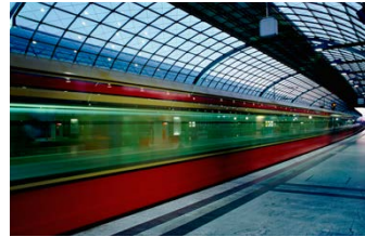
Abbildung 6: Wie Züge haben auch Texte eine optimale Länge.

So wie Fahrgäste eine ruhige Fahrt wünschen, so erwarten Leser eine gute sprachliche Aufbereitung. Wir bitten Sie daher auf die Rechtschreibung und klare, eindeutige Wortwahl